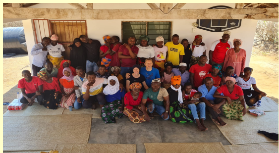
An einem Eheseminar in Zusammenarbeit mit YWAM nahm sogar eine Halifa mit ihrem Mann teil. Eine Halifa ist eine muslimische Lehrerin in einer Madrassa.