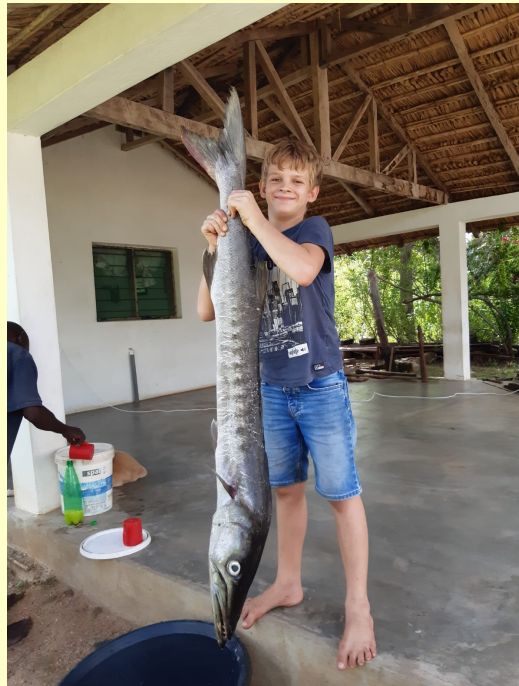
Isaak und der Barracuda. Von Fischern gekauft.